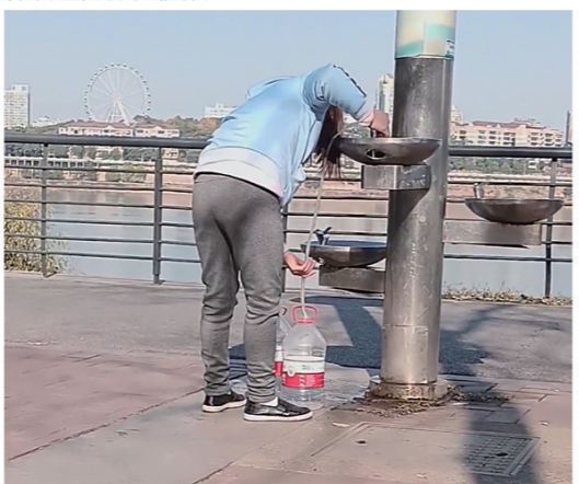
么明目张胆? 长期有人在株洲的沿江风光带接饮用水,这

#株洲爆料# 网友投稿,长期有人明目张胆的在株洲的沿江风光带接饮用水,这能省出一个亿来? 株洲魅的微博视频