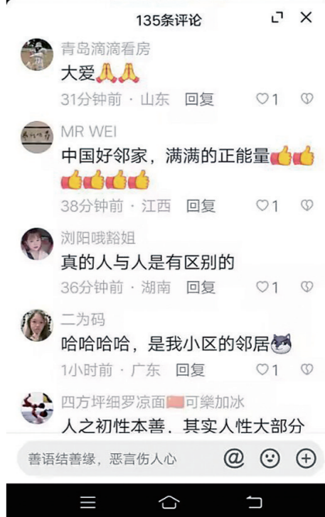
网友评论。(编辑截图)