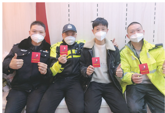
▲株洲公安系统组织无偿献血活动。

本报讯(株洲晚报融媒体记者/刘琼 通讯员/彭碧莹)12月16日,株洲公安系统组织无偿献血活动,这场爱心接力让这个冬日暖意十足。