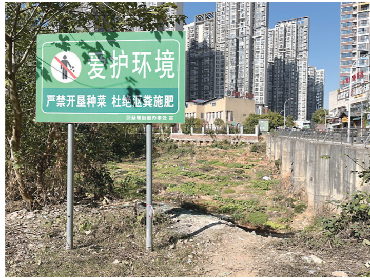
▲荷塘星城小区附近,一处菜地的警示牌形同虚设。

本报讯(株洲晚报融媒体记者/刘平)“占着路边空地种菜,乐此不疲……”12月19日,有市民拨打本报新闻热线 28829110 反映,在荷塘区荷塘星城小区、天元区日盛·山湖城小区的周边,占用空地种菜的现象严重,存在沤肥、盗用消防栓浇菜等现象,对环境、市容市貌造成一定影响。