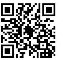
▲ 市民可以微信扫码扫二维码投诉举报。

广大市民在购买防疫类药品、医疗器械及用品时，如发现商家不明码标价、哄抬物价、违规搭售等侵犯消费者合法权益行为，可留下具体商家信息后，通过12345、12315或“一码通”平台进行投诉举报。市市场监管局收到留言将及时与消费者取得联系，开展现场核查，同时保护好消费者个人信息。