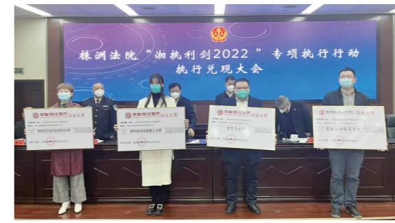
▲ 部分申请执行人现场领取现金支票。

本报讯(株洲晚报融媒体中心记者/贺天鸿)12月16日，市中级人民法院召开“湘执利剑2022”专项行动执行兑现新闻发布会，通报全市法院“湘执利剑2022”专项行动及执行工作情况，并当场兑现执行款1.33亿元，会上还发布了全市法院执行十大典型案例，书面发布了信用修复十大典型案例。