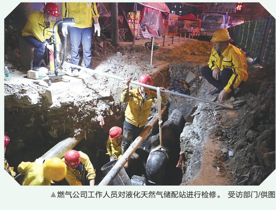
▲ 燃气公司工作人员对液化天然气储配站进行检修。 受访部门/供图