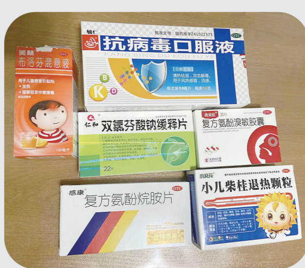
小天居家隔离治疗时,同事为他送来的药品和食物。