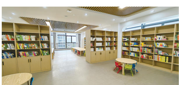
荷塘区文化馆新馆内部实景图。

株洲日报讯(全媒体记者/汤媚 通讯员/谭杰)近日,记者从荷塘区文化旅游体育局了解到,荷塘区文化馆新馆(以下简称“荷塘区两馆”)已实现主体完工并落成,预计12月底开馆。