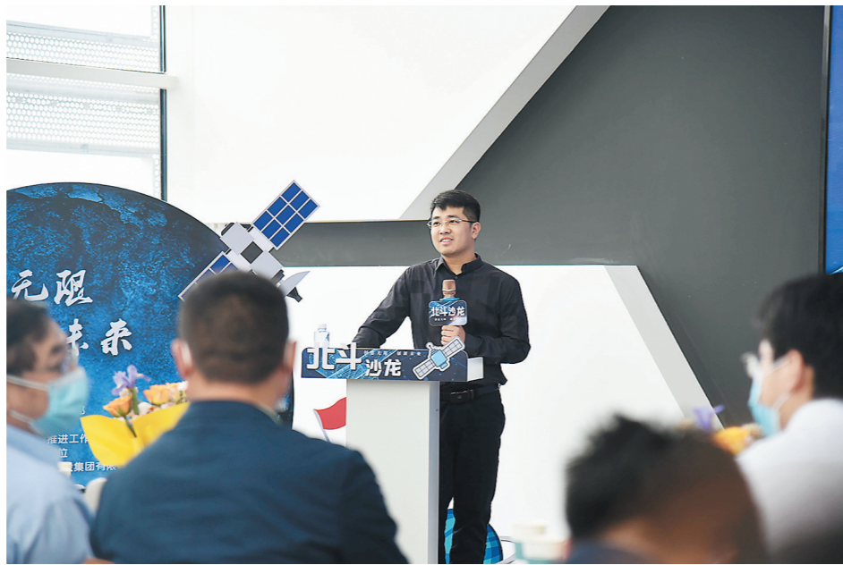
“北斗沙龙”活动现场。

开展多元培训,在常学常新中提升能力。近年来,株洲经开区紧扣“三高四新”战略定位和使命任务,根据干部现状和工作需要,统筹研究制定党委部门、经济部门、社会事业部门、执法部门、镇街系统5大重点岗位干部专业素养库,采用线上问卷调查形