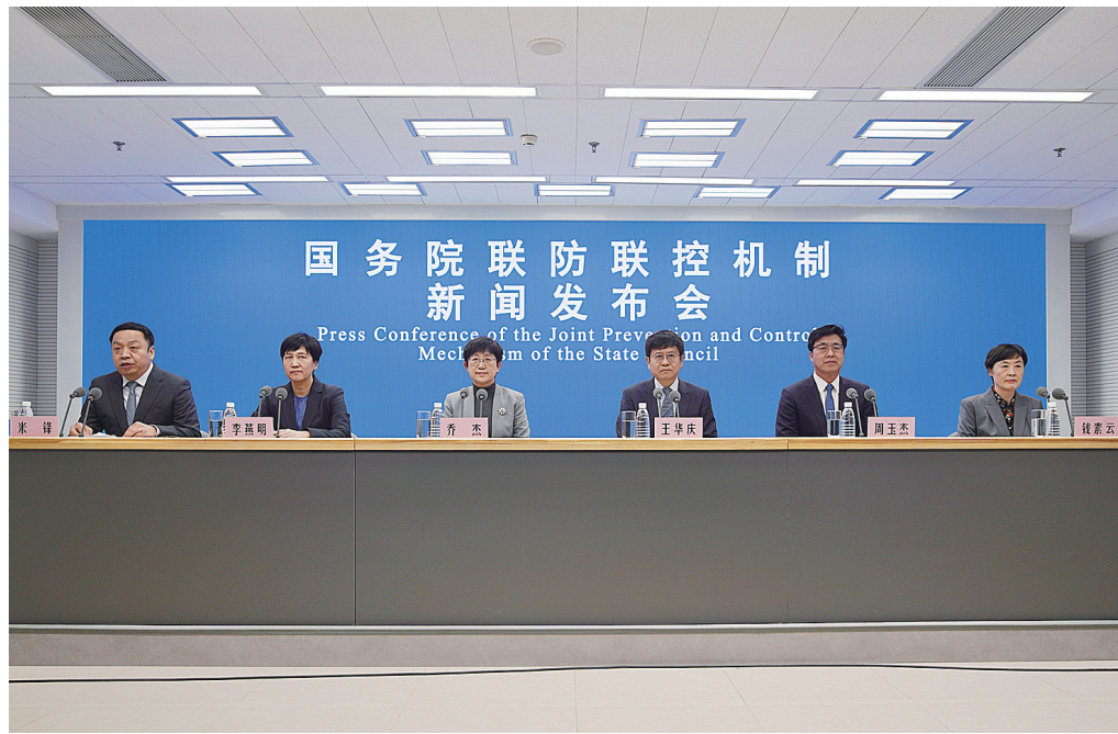
12月13日，国务院联防联控机制在北京召开新闻发布会，介绍重点人群健康管理等有关情况，并回答媒体提问。

“对于孕产妇来说，预防最重要。有可能的话，还是尽可能少到公共场所去，不聚会、不聚餐。”北京大学第三医院院长、中国工程院院士