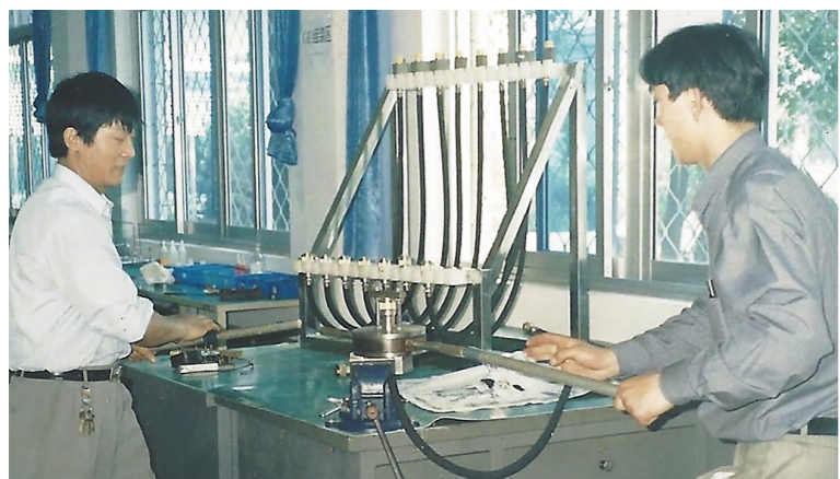
▲宁波分所的员工在工作中(资料图片)。

1989年,当时国家科委提出“内地有实力的科研院所可以到沿海地区建立窗口或分所”,铁道部株洲电力机车研究所(现中车株洲所)当时就作了决定,去沿海办分所,最终筹建了宁波分所。