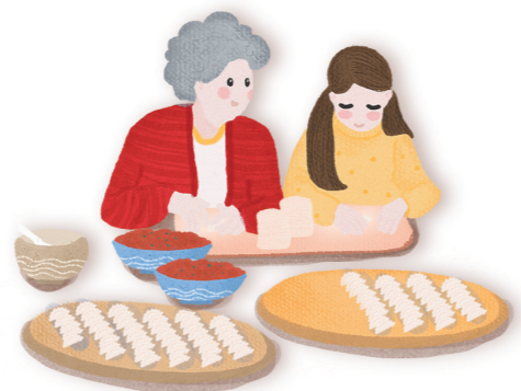
今天,阳光明媚,我和妈妈坐在露天阳台上包饺子,暖暖的阳光照耀着我们,舒服极了!

我的家乡四季分明,很美丽。 春天,土壤里的种子破土而出,冒出了嫩绿的芽叶,风轻轻一吹,嫩芽就弯下了腰,像在跟大地鞠躬。 夏天,火红的太阳高高地挂着,像大大的火炉照着大地,树叶碧绿碧绿的,就好像喷上了一层绿色的油漆。 秋天,天气变凉,树叶像蝴蝶一样飘下来,柿子穿着橙色的外衣,像一个个小灯笼,挂在高高的树上。 冬天,天气变冷了,树叶全落光了。粉色的梅花独自开放,像高贵的少女,含羞带笑。 我爱家乡,更爱家乡的四季。