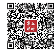
▲扫码可查各医疗机构联系电话。

市卫健委提醒，市民要做好自我健康监测和防护，如出现发热、咳嗽等症状，及早到附近医疗机构发热门诊(诊室)有序就医。