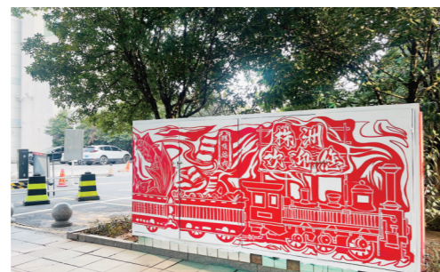
▲一批极具“株洲元素”的彩绘亮相街头。

本报讯(株洲晚报融媒体中心记者/伍靖雯)由我院校学生、专业设计师为株洲量身打造的户外广告创意图,变身街头美丽风景线。这几日,市城管局户外广告管理处组织对临街建筑空白墙面、配电箱等进行喷绘美化,创意设计、彩绘师都来自株洲。 12月12日,天元区天台路、黄河南路等路段的配电箱、通信箱换了“新装”,比如中国剪纸风格的“株洲欢迎您”、Q版造型的炎帝以及行驶中的“智轨”列车等,一幅幅构思巧妙、主题鲜明的彩绘,吸引着市民驻足观看。 此前,我市城管部门组织开展“最美户外广告”等系列评选活动,并邀请湖南工业大学的志愿者们,将这些优秀的获奖作品转化为彩绘,在天台路、建设路、泰山路、庐山路等12条道路以及跨江大桥桥墩空白墙面等区域展示,共计800余处,计划在年底陆续亮相。