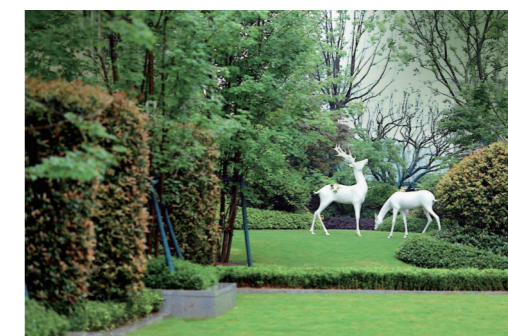
▲美的·雪峰山壹号实景图

8月6日,美的·雪峰山壹号12栋、13栋交付在株洲当地引发关注,此次交付原本的日期为11月30日;提前了4个月交房,让广大美的·雪峰山壹号业主倍感惊喜。