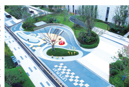
▲东部美的城·公园里实景图

11月,面对疫情,东部美的城·公园里团队不断想办法,线下无法开展工作,那就全部实现线上办公,为如期交房提供强有力的保障。 解封之后,验收工作马上如火如荼的进行,相关工作人员加班加点,质量与速度并重,品质与时间并进。11月30日,所有的努力都化成了一句——“如约而至,欢迎回家!”