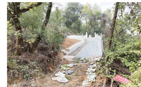
▲响田东路边,新硬化的墓地。

本报讯(株洲晚报融媒体记者/刘平)紧挨道路,毁绿建坟……12月10日,有市民路过石峰区响田大桥附近的响田东路路段时发现,路边树林中一片因破坏植被形成的泥地,已被硬化成一座占地数十平方米的墓地。