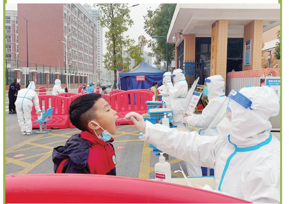
经专业培训,教师为学生采集核酸。

株洲日报讯(全媒体记者/戴凛 通讯员/朱丽萍) 12月12日,芦淞辖区各小学、幼儿园全面恢复线下教学。昨日上午,各小学开展核酸采集工作,为学生复课做最后的准备。