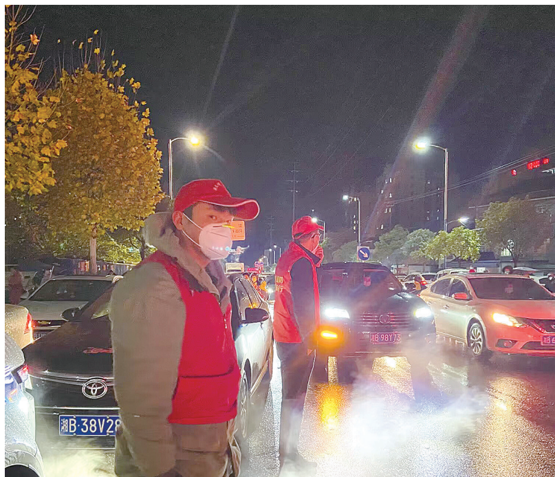
茶陵“夜鹰”巡逻队在维护校园周边秩序。

据了解,茶陵县“夜鹰巡逻队”自去年9月成立,人员从最初100人发展到234人。除了进行常规巡防外,还开展寒暑假“红星闪耀·未·你而行”“三考”后预防学生“大解放狂欢”“教育护航党的二十大”等专项行动。而今,茶陵通过“夜鹰巡防”优化了校园周边环境,有效预防和遏制了未成年人违法犯罪,大大提升了社会对教育的满意度。