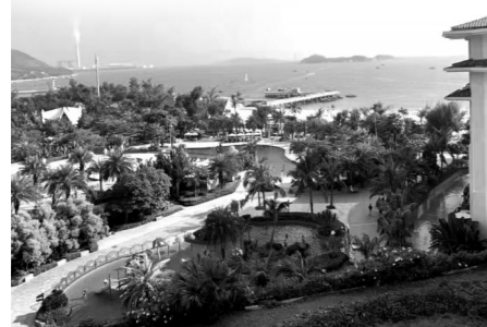
▲巽寮湾海滨风景区

巽寮湾位于惠东县城平山镇南部，地处北回归线以南，南海大亚湾的东部，依山傍海，山海相嵌，海天交融；属亚热带温湿型海洋气候，年平均气温21.7℃，总面积105平方公里。区内拥有得天独厚的滨海旅游资源，总长20多公里的海岸线内，有八个海湾，以石奇美、水奇清、沙奇白著称，被誉为“绿色翡翠”和“天赐白金堤”。巽寮湾的山、海滩、海岛巨石遍布，海湾一带有摩崖石刻30多处，海面隐隐约约分布着大大小小数十个洲。巽寮湾后三角岛是由三座相连的小山组成小岛，岛上泉水清澈，沙质柔软，峰奇石怪。