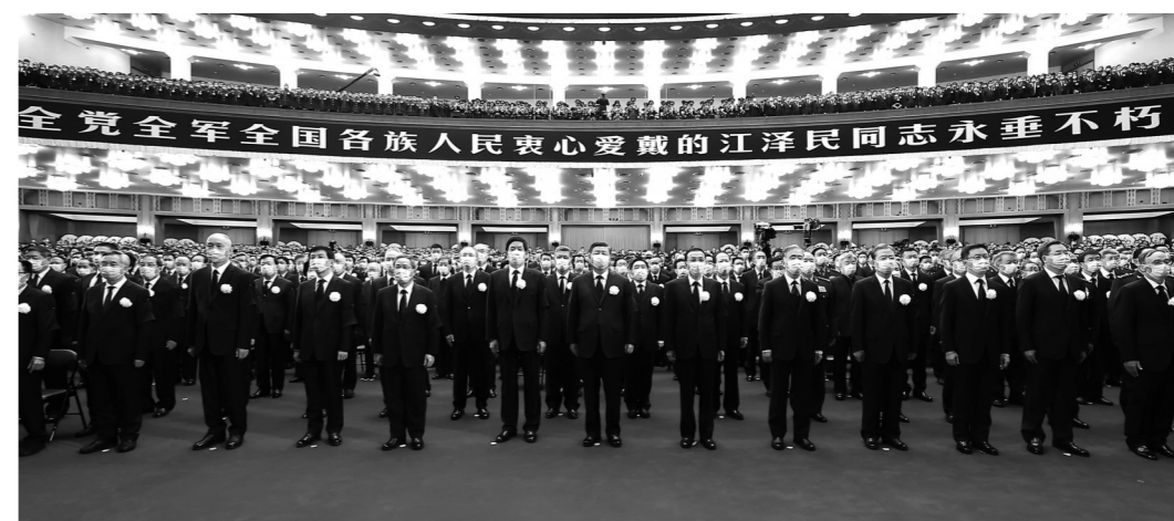
▲12月6日，中共中央、全国人大常委会、国务院、全国政协、中央军委在北京人民大会堂隆重举行江泽民同志追悼大会。习近平、李克强、栗战书、汪洋、李强、赵乐际、王沪宁、韩正、蔡奇、丁薛祥、李希、王岐山等参加大会。