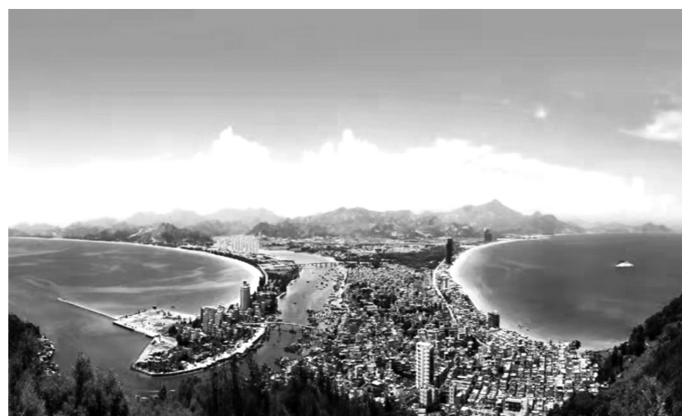
▲双月湾海滨风景区

七星岩位于肇庆市，七星岩以喀斯特溶岩地貌的岩峰、湖泊景观为主要特色，以峰林、溶洞、湖泊、碑刻、寺观为主体景观。被誉为“人间仙境”、“岭南第一奇观”。主要有水月岩云、星岩春晓、天柱摘星、星岩烟雨、玉屏叠翠、千年诗廊、水中林趣、卧佛含丹、仙鹤呈祥、石洞古庙等景点。