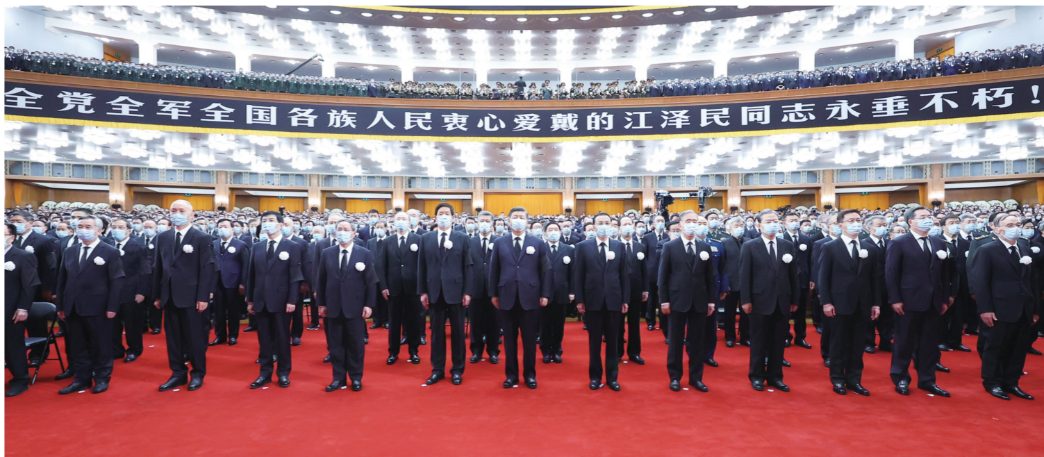
12月6日，中共中央、全国人大常委会、国务院、全国政协、中央军委在北京人民大会堂隆重举行江泽民同志追悼大会。习近平、李克强、栗战书、汪洋、李强、赵乐际、王沪宁、韩正、蔡奇、丁薛祥、李希、王岐山等参加大会。