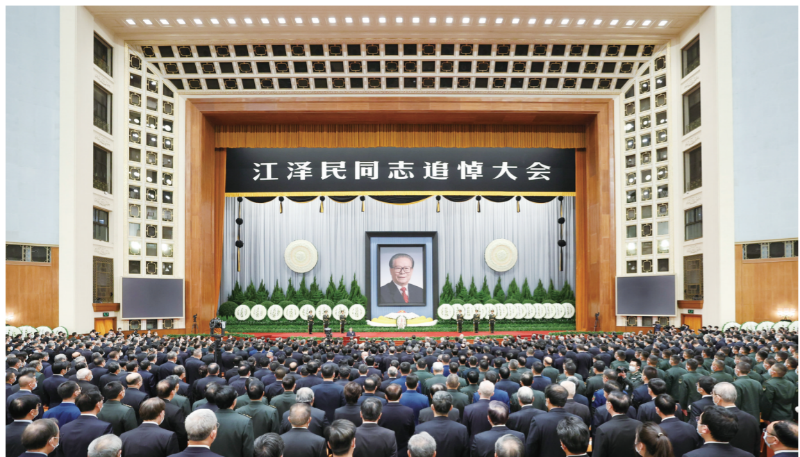
12月6日，中共中央、全国人大常委会、国务院、全国政协、中央军委在北京人民大会堂隆重举行江泽民同志追悼大会。