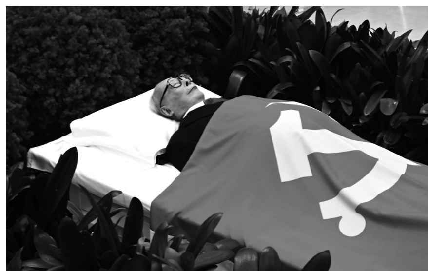
▲12月5日,江泽民同志的遗体安卧在鲜花翠柏丛中,身上覆盖着鲜红的中国共产党党旗。

新华社北京12月5日电 江泽民同志病重期间和逝世后,习近平、李克强、栗战书、汪洋、李强、赵乐际、王沪宁、韩正、蔡奇、丁薛祥、李希、王岐山、胡锦涛等同志,前往医院看望或通过多种形式对江泽民同志逝世表示沉痛哀悼并向其亲属表示深切慰问。