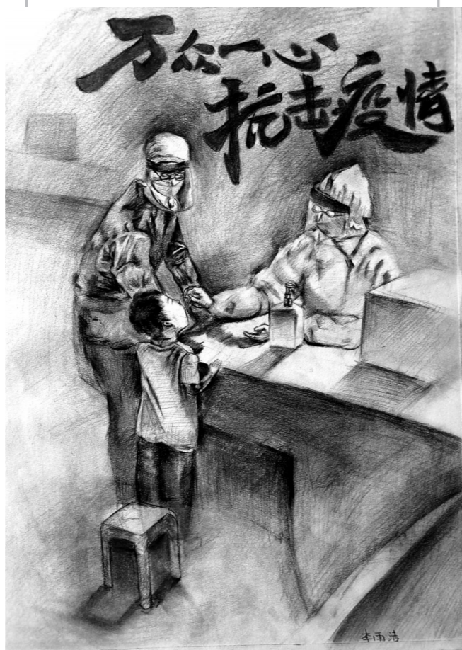
病毒无情,人间有爱。有的人,奔赴一线,逆行而去,有的人,坚守岗位,默默奉献。面对疫情,景弘学子积极创作,记录下抗疫前线的感人场面,记录这个时代的奉献与担当。