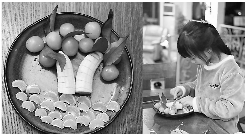
▲天元区白鹤小学学生居家期间大显身手，用水果拼出了“又美又甜”的作品，收获劳动带来的快乐。

本报讯(株洲晚报融媒体中心/孙晓静 通讯员/关好 林婧)广大家长一直关心的初中和小学复课安排来了。记者从多个区的教育局获悉，石峰区、株洲经开区初中学生于12月6日正式复课。荷塘区初中学生于12月7日、小学生于12月8日正式返校复课。芦淞区拟定于12月7日至12日，分批次错峰复课。