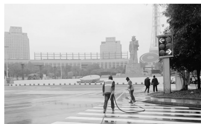
▲环卫工人在白天加强道路清洗作业。

本报讯(株洲晚报融媒体中心/伍靖雯 通讯员/张硕 易雄)气温走低,为做好防道路冰冻与市容环卫保障两不误,我市城管部门发文强调,室外气温达到或低于0摄氏度时,环卫车辆夜间冲洗作业暂停。