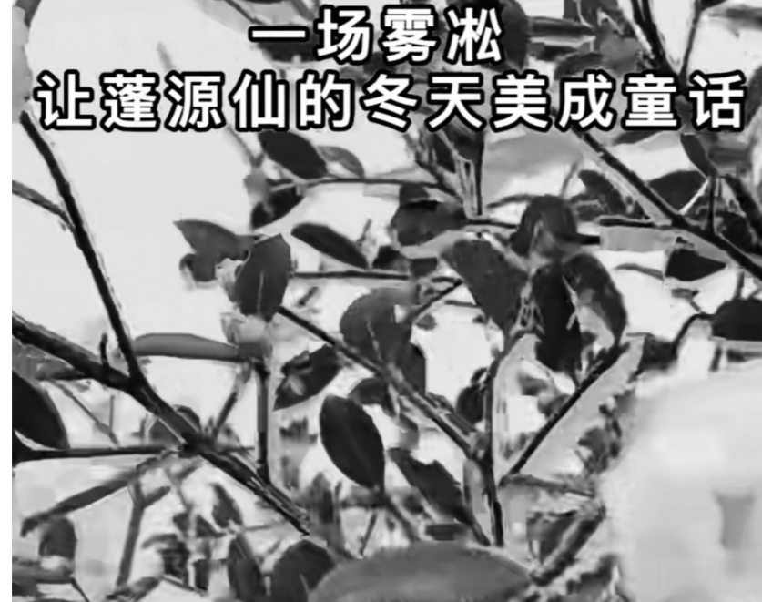
12月1日,受强冷空气影响,渌口区蓬源仙出现雾凇景观,银装素裹,美不胜收。