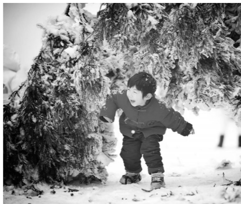
孩子们在大山的冰雪世界里嬉戏。