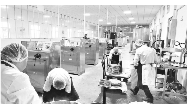
在茶陵九龙工业园,油茶加工实现了自动化生产。