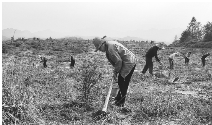
繁忙的冬季扩种场景。