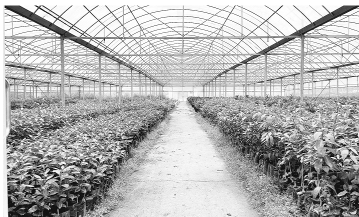
在攸县地杰农业育苗基地,1000万株油茶苗随时等待出棚发往全国各地。