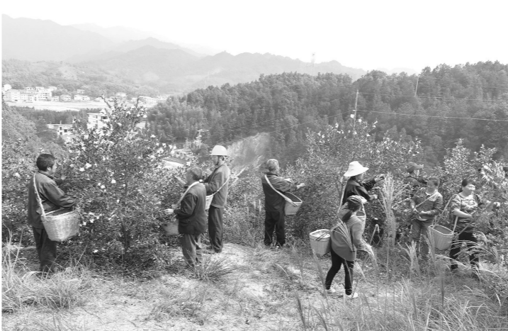
热闹的茶果采收现场。受访者供图