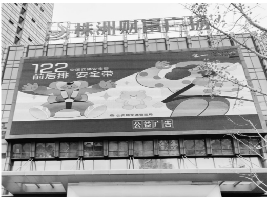
▲街头公益广告提醒大人和孩子都要系好安全带。

“为了短暂保暖而放弃安全,这并不可取。”交警说,头部是人体最脆弱也最容易受到致命伤害的部位,骑乘摩托车、电动自行车发生交通事故时,对驾驶员的冲击力很强。在此类交通事故中,不戴头盔的致死率远远高于其他因素。因此,不能因为戴了帽子而放弃安全头盔,家长要当好榜样。既是保护自己,也是保护孩子。