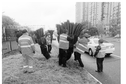
▲炎帝大道上,园林工人帮铁树防冻。

株洲晚报融媒体中心/伍靖雯 通讯员/颜淑婷 黄重)气温陡降,这几天,全市的园林工人忙着给树木“添衣”防冻,加固防风。