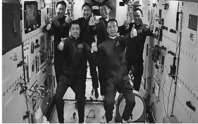
▲11月30日在酒泉卫星发射中心拍摄的神舟十五号航天员乘组与神舟十四号航天员乘组太空合影的画面。