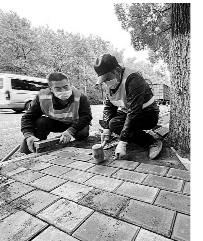
市市政工程维护中心的养护队员正在对枫溪大道人行道进行修缮。

株洲日报讯(全媒体记者/伍靖雯 通讯员/欧阳潮) 11月30日,芦淞区枫溪大道,市城管局市政工程维护中心的养护队员们将崭新的人行道地砖一块块摊铺平整,让原本因坑洞破损的道路重新平坦起来。 市市政工程维护中心有关负责人介绍,包括4条人行道、8条车行道修缮的市政道路中修工程目前正式启动,力争在年内全面完成。 4条正在进行专项维修的人行道,分别是杉塘路(建设路至人民北路)、枫溪大道东西两侧(市烟草局至天池路)、人民中路东西侧(体育路至红港路)以及果园路路段。 8条修缮的车行道,则分别位于市府路(人民南路至建设南路)、建设北路一段(清水铁路桥至天桥街)、建设北路二段(天桥街至清石广场)、枫溪大道(芦淞区自然资源局至小巨蛋酒店)、拥军路(建设南路至沿江路)、茨菇塘路(钻石路至长寿路)、文化路(新华路口至石宋路)以及人民北路(白石港路至人民路跨越铁路桥)路段。修缮的主要目的是解决道路坑洞沉降、人行道“水地雷”等问题。