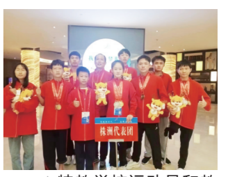
▲特教学校运动员和教练员合影。

本报讯(株洲晚报融媒体中心/戴凛 通讯员/李智)11月26日,湖南省第十一届残疾人运动会在岳阳市落幕。在本届省残运会中,株洲市特殊教育学校共派出10名选手参赛,获得6块金牌、5块银牌、8块铜牌。