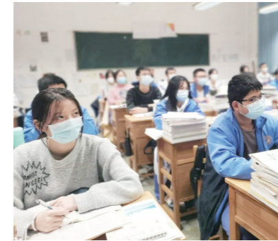
▲九方中学复课,同学们快速进入学习状态。

11月28日,市特殊教育学校迎来返校复课后的首次升旗仪式。与此同时,我市各高中各个年级的学生也陆续实现返校复课,校园正在有序的防控管理下变得更有活力。