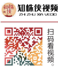
知林伏视频 ZHILIN VIDEO 扫码看视频

同时,入园游客进入景区禁止携带火种,禁止抽烟和使用明火,遵守政府森林防火相关规定。游客可通过湖南炎帝陵景区公众号、美团、携程等线上平台,或者致电0731-26321666进行入园门票购买及预约。