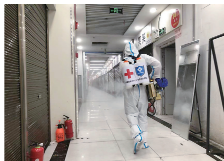
▲消杀队员在芦淞市场群消毒。

本报讯(株洲晚报融媒体记者/杨凌凌)连日来,芦淞区加强重点场所、重点部位的消杀力度,全力保障辖区内的环境卫生安全。