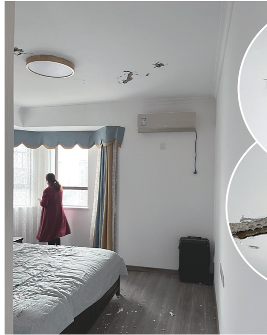
卧室地板上和床上有掉落的石灰块、水泥渣。

本报讯(株洲晚报融媒体记者/刘平)“地板上的水泥渣已清理过一次,现在又掉落了一地。”11月23日,天元区昆仑首府小区居民殷女士向本报记者求助,称其购买的商品房还不到5年,天花板就出现水泥脱落现象,多处钢筋裸露。