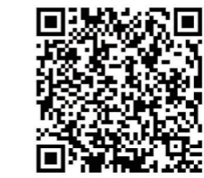
▲具体申报条件和相关表格可以扫描二维码查看与下载。

申报对象可按创业属地的原则,向登记注册所在地县市区人力资源和社会保障局申报;退役军人及随军家属也可向登记注册所在地县市区退役军人事务局申报;在校大学生向所在学校申报,学校初审通过后报市教育局。