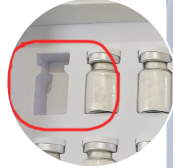
▲小容已使用的套盒内产品(红圈标注),商家表示产品不会全会影响第二次销售。