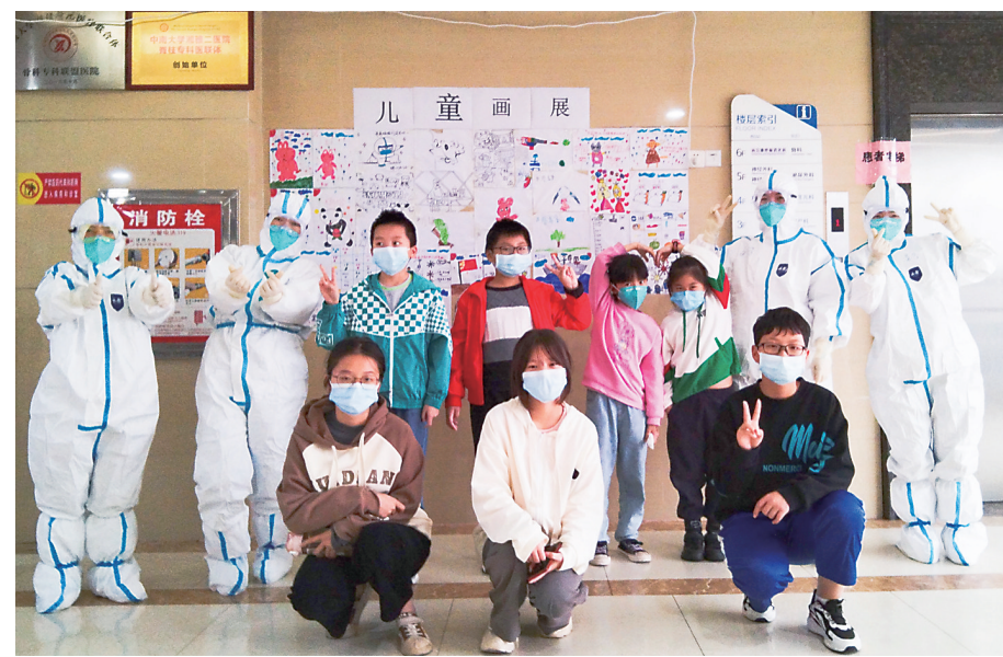
▲隔离病房里,孩子们展示画作。

本报讯(株洲晚报融媒体中心记者/刘琼通讯员/宋玺)11月19日,在株洲市新冠肺炎定点医院,一场特殊的儿童画展让病房内变得温情满满。原来,为了给医护人员鼓劲并表达谢意,正在隔离治疗的患儿纷纷拿起画笔,创作各种充满童趣的画作。