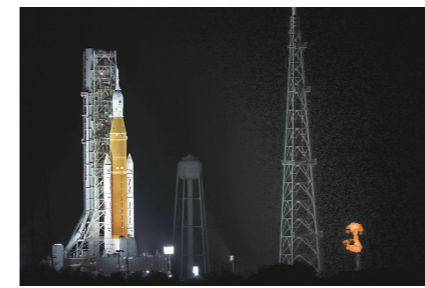
◀当地时间2022年11月15日,美国肯尼迪航天中心,美国新一代登月火箭静待发射。

美国东部时间16日1时47分(北京时间16日14时47分),美国航天局新一代登月火箭“太空发射系统”首次发射升空,执行“阿耳忒弥斯1号”无人绕月飞行测试任务。 经过一段时间准备后,“太空发射系统”搭载“猎户座”飞船从佛罗里达州肯尼迪航天中心的39B发射台发射升空。 据美国航天局介绍,此次“阿耳忒弥斯1号”任务时长约25天11小时,“猎户座”飞船飞行距离约209万公里(130万英里)。飞船预计于12月11日返回地球,溅落在美国加利福尼亚州圣迭戈附近海域。 此次任务旨在测试“太空发射系统”的性能表现以及“猎户座”飞船的能力,主要目标是在太空飞行环境中检验飞船的各项系统,在后续执行载人试飞任务前,确保飞船返回大气层、下降、溅落海面、回收等各环节的安全。 美国航天局表示,“阿耳忒弥斯1号”无人绕月飞行测试任务是美国一系列月球探索任务的第一步,将为后续载人探月任务奠定基础。 此前,美国航天局先后因火箭引擎故障和火箭燃料输送故障,两度推迟“阿耳忒弥斯1号”任务发射。 “阿耳忒弥斯”是美国政府2019年宣布的新登月计划,最初计划在2024年前将美国宇航员再次送上月球。由于预算不足等原因,美国航天局2021年宣布,美国宇航员重返月球的计划时间推迟,最早于2025年登月。在宇航员登陆前,美国航天局计划开展代号为“阿耳忒弥斯1号”的无人绕月飞行测试和代号为“阿耳忒弥斯2号”的载人绕月飞行测试。 (摘编自新华社)