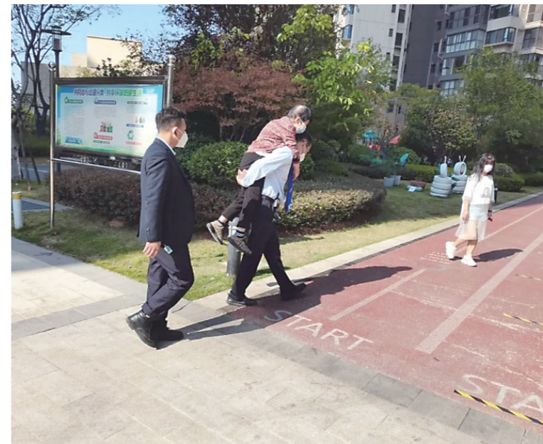
▲得知喻阿姨出门不便,美的蓝溪谷物业服务中心工作人员主动上门背着喻阿姨下楼做核酸采样。