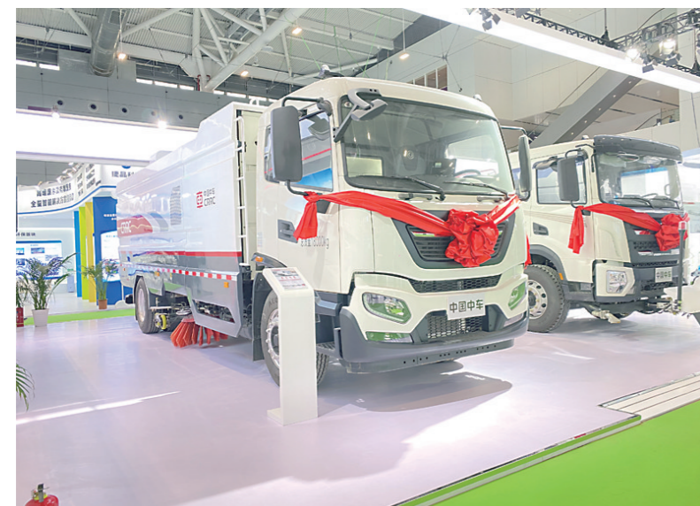
▲中车电动的纯电动洗扫车。

本报讯(株洲晚报融媒体中心/高晓燕 通讯员/唐蓉)11月15日至17日,2022第23届中国环博会正在深圳举行。会上,中车时代电动汽车股份有限公司多款环卫装备实力亮相。 本次亮相环博会的中车电动环卫装备纯电动洗扫车,曾在中国机械工业联合会主办的2020“遼博杯”首届全国机械工业设计创新大赛中获得大奖,是当之无愧的“城市美容师”。“箱体扩容”技术,是中车电动洗扫车的‘看家本领’。该技术使箱体容积比普通产品高20%以上,车辆清洗力比普通产品高10%,能耗比普通产品低10%以上,可实现持久、高效、低能耗作业。”中车电动技术专家介绍。 中车电动的纯电动清洗车,是该