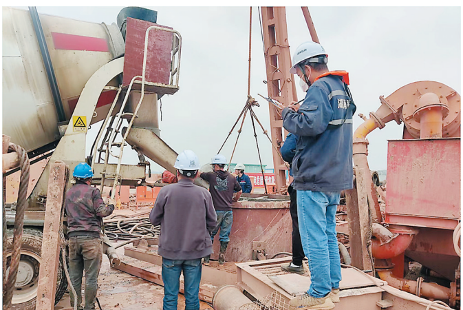
醴娄高速株洲湘江特大桥13号墩9号桩基浇筑成功。

醴娄高速是上海至昆明国家高速公路醴陵至娄底段的扩容项目。项目起于湘潭市王仙镇双江村,由东向西经株洲市醴陵区、渌口区、天元区,湘潭市湘潭县、湘乡市,娄底市双峰县、娄星区,止于娄底市娄星区蛇行山岭,与娄怀高速公路相接。项目全长154271公里,路基宽34米,主线采用双向六车道高速公路标准建设,设计时速为120公里,总工期48个月。