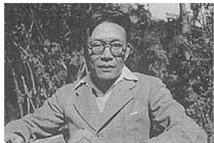
▲我国著名哲学家金岳霖。

金岳霖是我国著名的哲学家、逻辑学研究专家。即使在年纪并不大时,他居然已经开始有些“忘我”。说起来,似乎好笑。据冰心先生讲,有一次金岳霖告诉她一件事,说一次出门访友,到人家门口按了门铃,朋友家女仆出来开门,问金岳霖“贵姓”。金岳霖一下子“蒙了”,他一下子忘了自己“贵姓”,怎么也想不出来。没有办法,他对女仆说,你把主人叫出来,他知道我是谁。女仆说,你说不出来,我们主人是不见的。没办法,金岳霖说:你等一下,我去问问我的司机。惊得那位女仆张着嘴半天说不出话来。告诉冰心这件事时,金岳霖还幽默地说:我这个人是老了,我的记性坏到了“忘我”的地步!