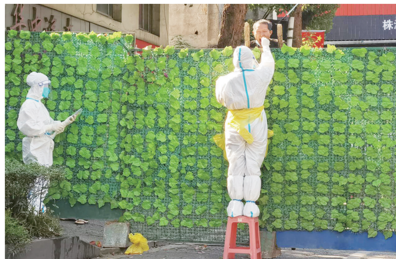
11月11日,荷塘区茨菇塘街道开展了新一轮区域核酸检测。荷塘区黄家塘社区与芦淞区交界处,围挡两侧,“大白”搬来小凳,居民们架起了楼梯,双方配合默契,快速完成了近千户居民的核酸检测采样。