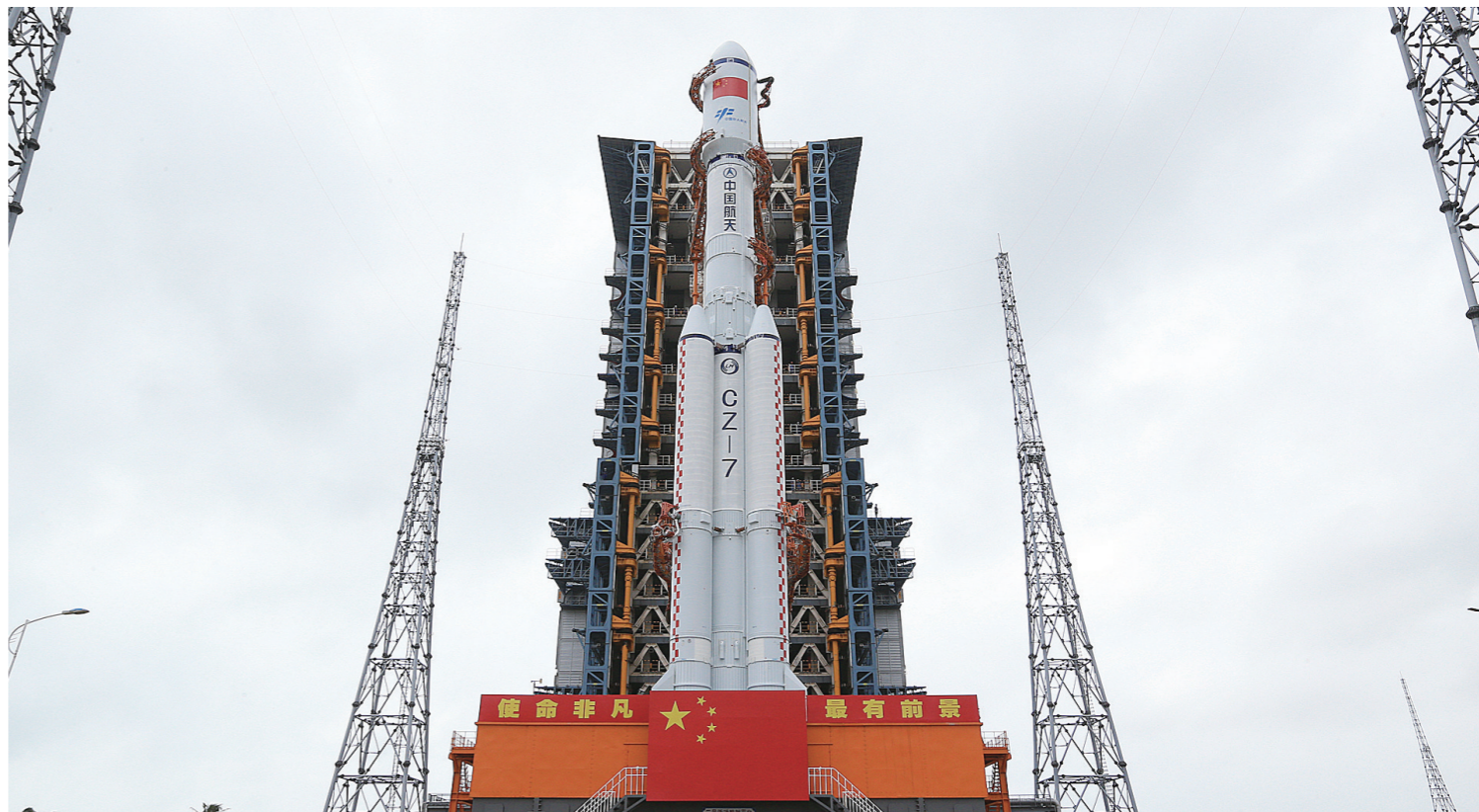
11月9日，天舟五号货运飞船与长征七号遥六运载火箭组合体转运至发射塔架。

据新华社 记者从中国载人航天工程办公室获悉，11月9日，天舟五号货运飞船与长征七号遥六运载火箭组合体垂直转运至发射区，计划于近日择机实施发射。11月9日14时55分，已完成既定任务的天舟四号