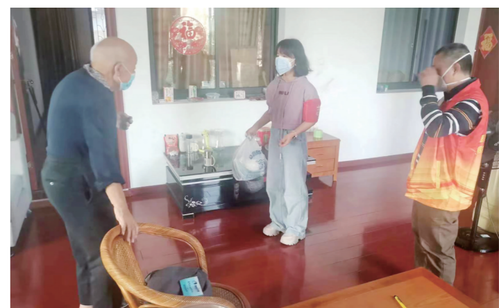
▲工作人员上门为唐爷爷送物资。

本报讯(株洲晚报融媒体中心记者/杨凌凌 通讯员/赵楚莹)“不是亲人胜似亲人。”11月7日,董家墩街道南苑社区卫生村散户唐爷爷的家属通过微信发了一封感谢信,感谢董家墩街道工作人员对其父亲的照顾。