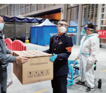
▲药品安全送达醴陵。

由于众多民警的勇毅向前、默默坚守,一个又一个暖心的“疫”线故事在不断上演。 11月5日上午,经开公安分局