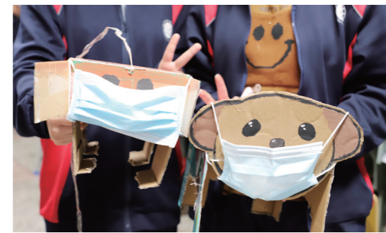
▲寄宿生制作戴口罩的“纸箱小狗”。