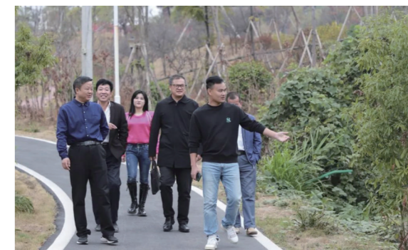
▲市八中相关负责人探访劳动教育基地。

本报讯(株洲晚报融媒体记者/戴凛 通讯员/钟芳杰)推进素质教育,落实“立德树人”根本任务,全面落实“五育并举”,提升学生的综合实践能力和素养。日前,株洲市八中与株洲市示范性综合实践基地、健坤生态园劳动教育实践基地正式签约。