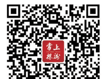
扫二维码查看附件。