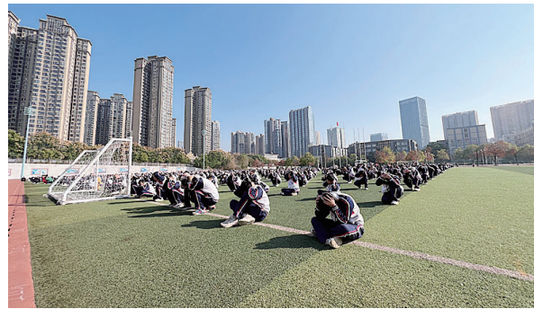
白鹤学校初中部全体师生参加疏散隐蔽演练。

“预先警报”鸣放方式为警报鸣响36秒,停24秒,反复3遍为一个周期;“空袭警报”鸣放方式为警报鸣响6秒,停6秒,反复15遍为一个周期;“解除警报”鸣放方式为连续鸣响3分钟。试鸣时,各信号之间的间隔时间为5分钟。据市人防办相关负责人介绍,今年是《湖南省人民防空通信管理办法》颁布施行的第15年,也是湖南省实施11月1日防空警报统一试鸣制度的第22年,“在11月1日这个特殊的日子里进行防空警报试鸣,组织人口疏散隐蔽演练,一方面有效检查防空设备的运行情况,提升城市的防空应急能力;另一方面也宣传了防空知识,增强广大市民的国防观念和防空意识。”