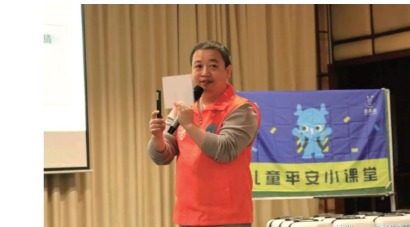
▲公益活动中的黄金。

作为一名“老”志愿者,他特别注重公益理念的传播。多次走进高等院校,与各院校的大学生志愿者和志愿者团队进行交流和座谈达20余场,不断把公益思想和理念传播给大学生。2020年起,他作为壹基金儿童平安项目认证讲师,奔赴在周边各省份之间,为更多社会组织、志愿服务团队传播志愿服务理念。