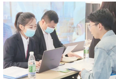
▲招聘会走进江西高校。

本报讯(株洲晚报融媒体记者/何春林 通讯员/周敏)10月26日至27日,“智汇潇湘·才聚株洲”先进制造业招聘会,走进南昌大学、东华理工大学,收到了467份简历。