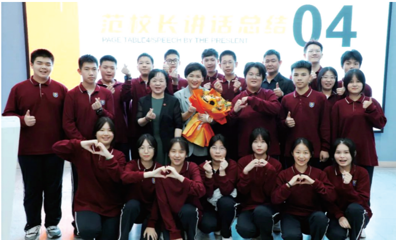
▲公益讲座结束后,师生与李丹留影。

本报讯(株洲晚报融媒体记者/宋芋璇 通讯员/赵秋妍)10月26日下午和晚上,株洲市远恒佳景炎高级中学多功能厅座无虚席,全校学生分两批聆听了长沙广电新闻中心著名主持人、国家主任播音员李丹所作的《思路决定出路,选择决定未来》的生涯规划公益讲座。