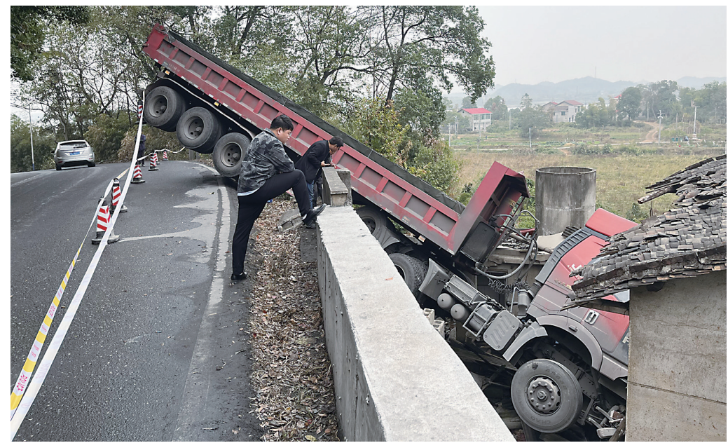
▲大货车冲出道路,撞上民房。

本报讯(株洲晚报融媒体记者/刘平)“这是近5年来,我家遭遇的第4次交通事故了!”10月28日下午,天元区三门镇湖坪村下湾组,68岁的村民吴志贱回顾住房被撞的经历时,仍心有余悸。10月27日晚上11时50分左右,一辆大货车从他家屋后的转弯路段冲出,“一头栽进”他家,导致房屋受损。