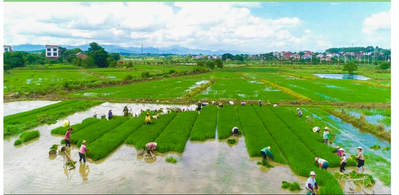
这里是盆地,水肥土美,适合水稻、荞麦、渔业发展。