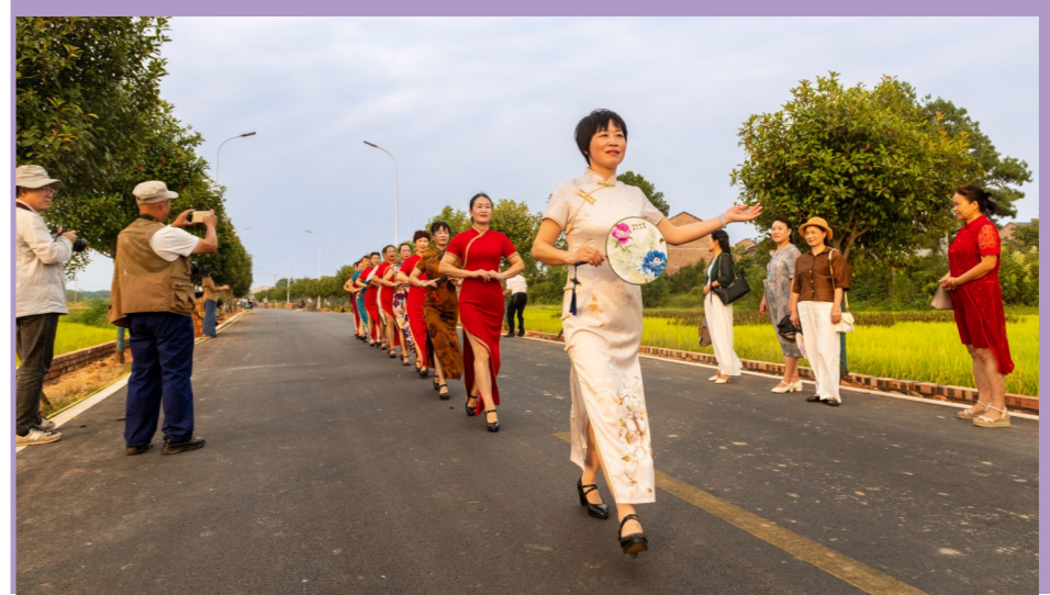
乡村大妈模特队在田间机耕道上走秀,大爷们在围观、拍照。