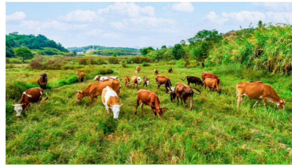
诸睦村的牛、羊、猪养殖业有天然优势。