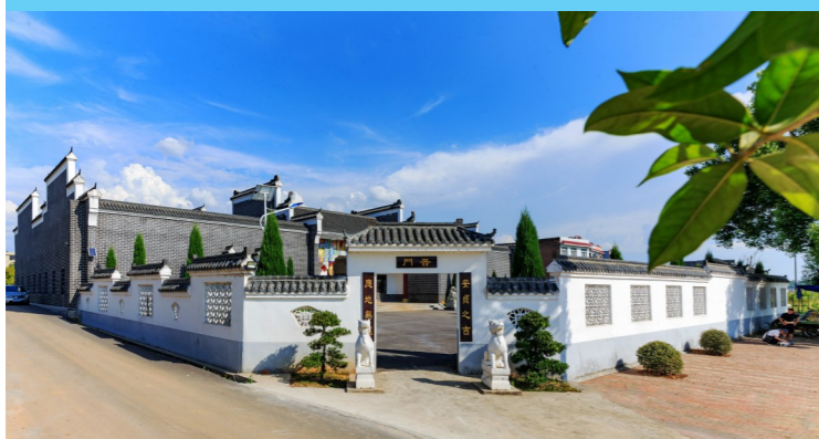
村里这种粉墙黛瓦的建筑还有很多。