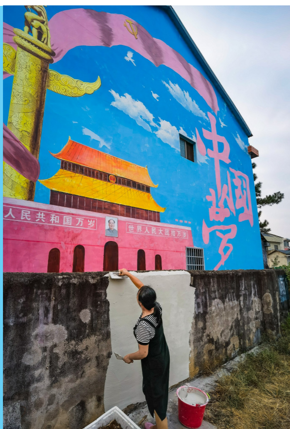
村民在国庆节前,涂刷美化自己的家园。