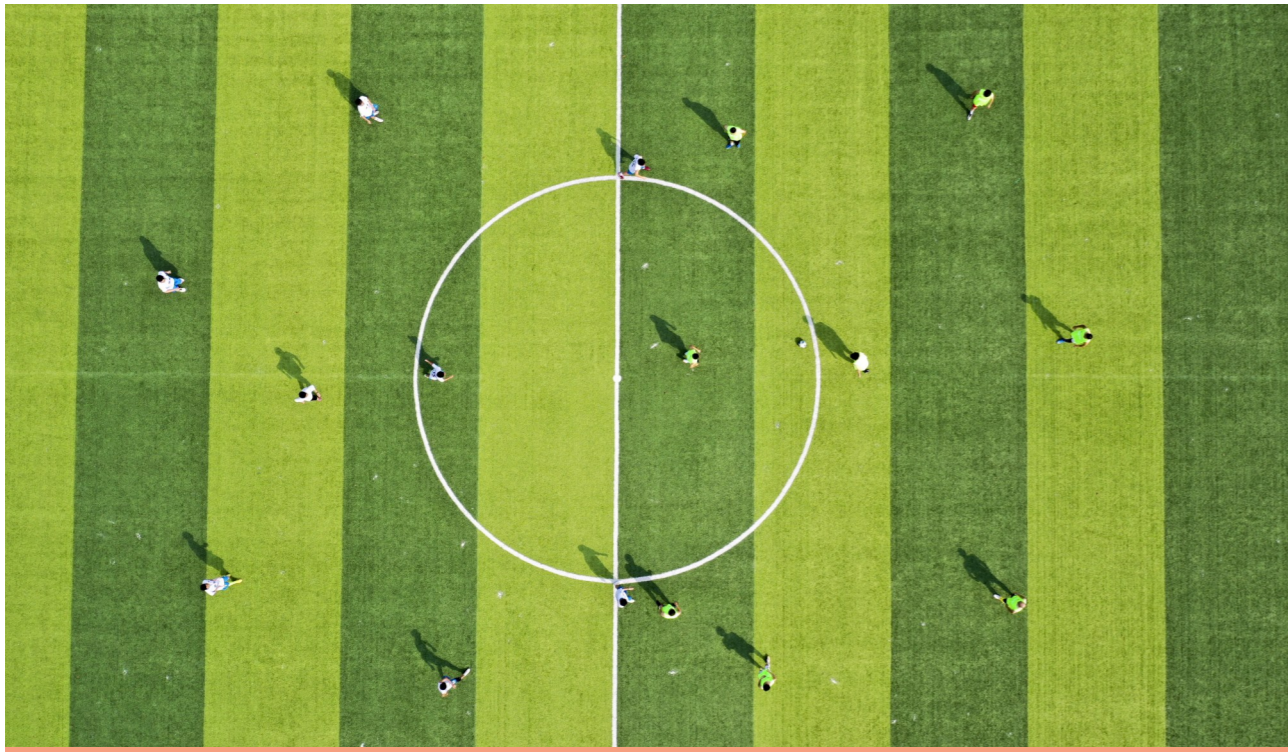
诸睦村的足球场,图片登上了《经济日报》。