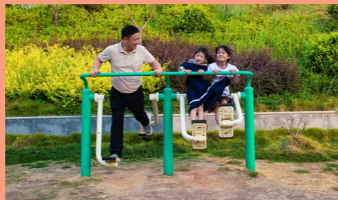
村里的健身设施。