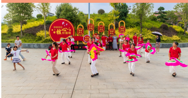
孝文化广场的广场舞。