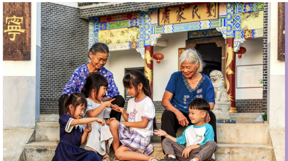
其乐融融的幸福邻里。

利用沿河长5公里近500余亩土地与自然生长的百年樟树林,因地制宜完善人行游道,初步打造出季节性花海,建设生态走廊,提质改造风景休闲农业区,用花草苗木将村内景点相连,推进生态旅游。规划体育公园占地面积17.49万平方米,拟投资5800万元,正在着力将公园打造成亲子趣味运动休闲区、体育对抗运动区、老年运动休闲区、生态休闲区、中心活力广场等于一体的体育公园,以满足各项大型运动比赛的不同需求。