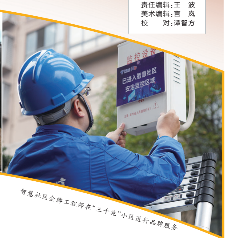
智慧社区金牌工程师在“三千兆”小区进行品牌服务