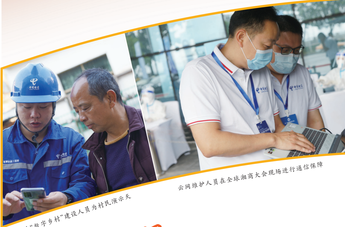
云网维护人员在全球湘商大会现场进行通信保障