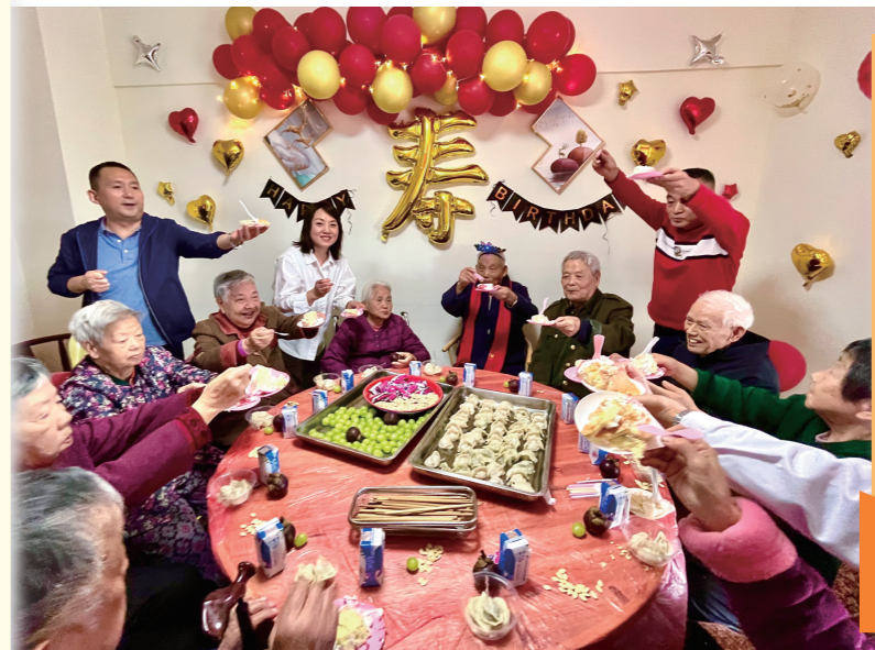
▲热闹的集体生日。