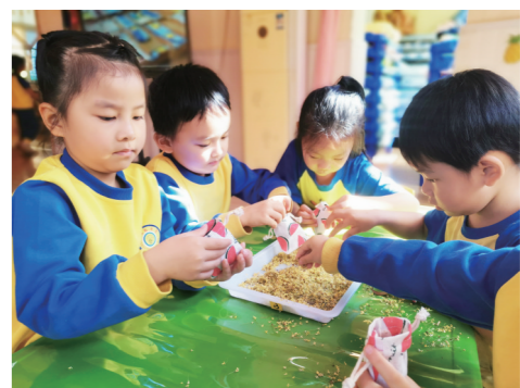
▲孩子们动手制作桂花香包。

本报讯(株洲晚报融媒体记者/戴凇 通讯员/何焰)10月24日,天元区钻石贝贝幼儿园的孩子们与桂花来了一次亲密接触,孩子们在劳动中收获了香甜的幸福。