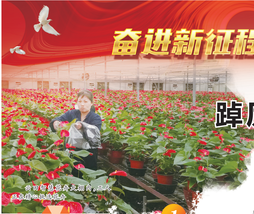
云田镇花卉产业园内，工人正在精心挑选花卉。