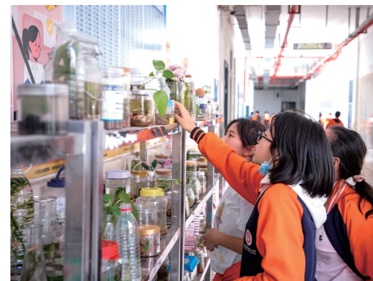
▲活动对优秀作品进行展出,吸引了学生的围观。

本报讯(株洲晚报融媒体通讯员/贺晓玲 陈明)近日,市二中初中部初一年级生物组为贯彻落实生物新课程标准中对培养学生“生命观念、科学思维、探究实践、态度责任”的学科核心素养要求,根据教学内容与学情,开展生物学系列学科活动之“生态瓶制作”活动。学生积极动手参与,学校最终收到生态瓶作品400余件。