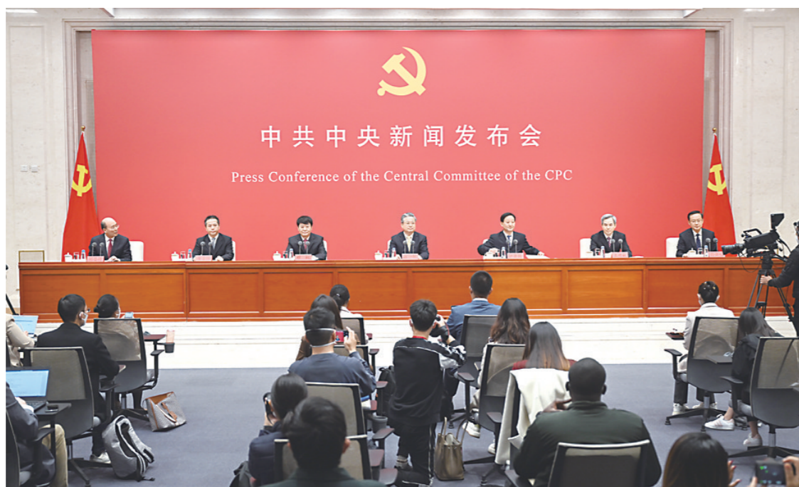
▲10月24日上午,中共中央举行新闻发布会,介绍解读党的二十大报告。

10月24日上午,中共中央举行新闻发布会,介绍解读党的二十大报告。中央政法委秘书长陈一新,中央政策研究室主任江金权,中央改革办分管日常工作的副主任、国家发展改革委副主任穆虹,中央纪委监委国家监委宣传部部长王建新,中央办公厅副主任兼调研室主任唐方裕,中央宣传部副部长孙业礼等有关方面负责人解读党的二十大报告并回答记者关心的问题。