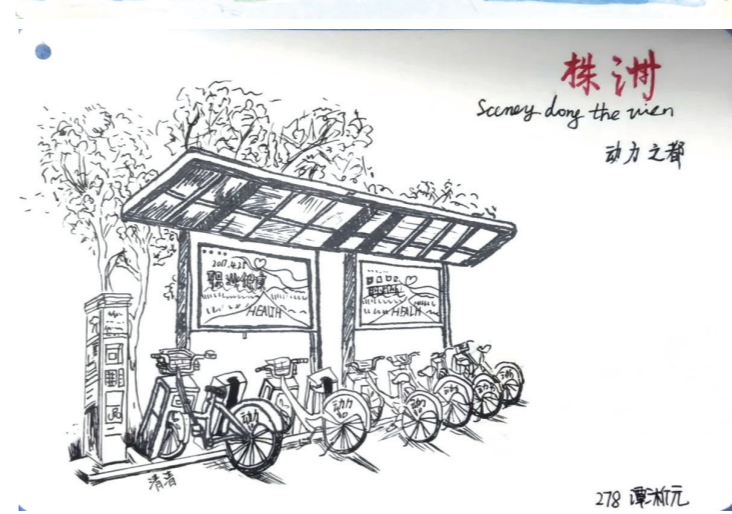
▲一些学生将神农塔、公共自行车站点画成明信片。

本报讯(株洲晚报融媒体记者/宋芋璇 通讯员 王佳弈)“选择株洲市的一个自然或人文景点,也可以是株洲市的一个文化特征,各人介绍,设计一张属于你自己的家乡明信片。”近日,株洲外国语学校地理组的老师给学生布置了一项特别的作业——“家乡名片设计”。希望学生自己设计明信片,将家乡特色和美景推荐给外地朋友。