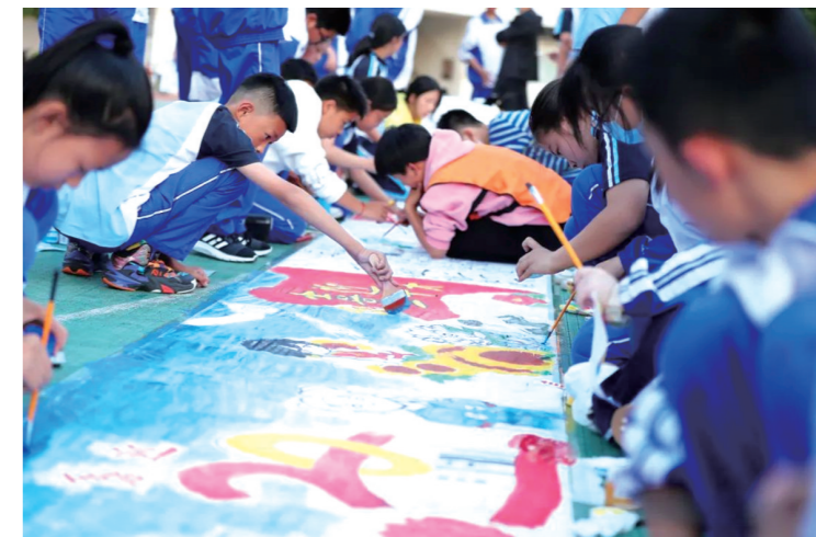
▲或跪或趴、或描或涂,学生忙得不亦乐乎。

本报讯(株洲晚报融媒体记者/宋芋璇 通讯员/谢霞)近日,伴随着秋日暖阳,700多名景炎学子席地而坐,在纯白的画布上挥笔作画,将“爱国爱家爱校”、“礼赞二十大”、“学党史·颂党风·跟党走”等内容生动展现,也将自己在党的关怀下幸福成长的情景展现在百米画卷上。