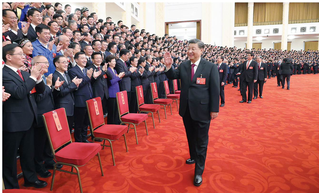
10月23日下午，中共中央总书记、国家主席、中央军委主席习近平等领导同志在北京人民大会堂亲切会见出席党的二十大代表、特邀代表和列席人员，并同大家合影留念。