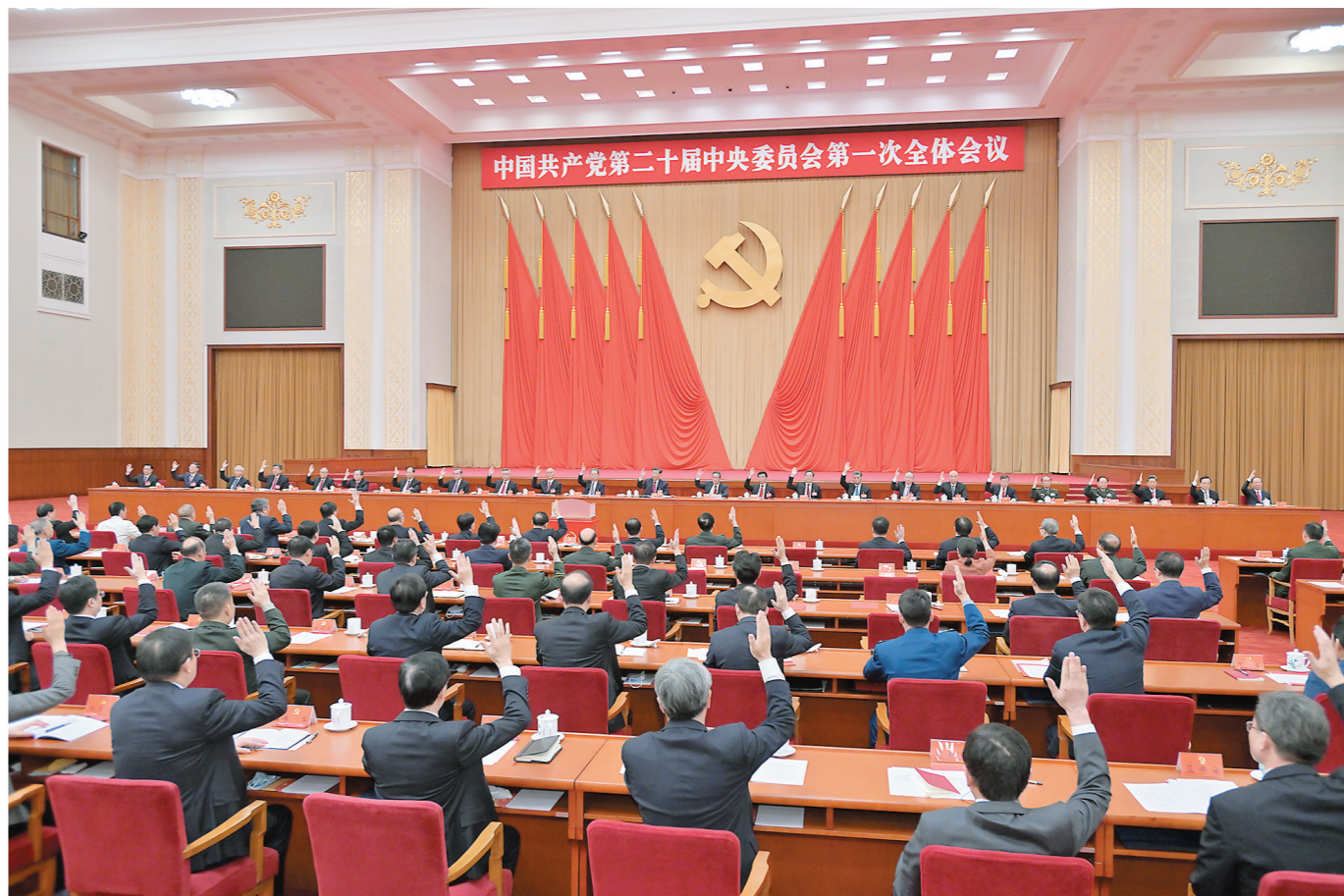
上图：10月23日，中国共产党第二十届中央委员会第一次全体会议在北京人民大会堂举行。