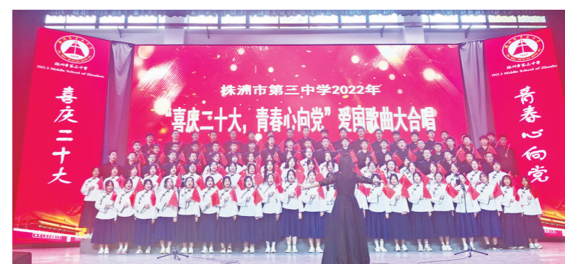
10月19日下午,株洲市三中开展2022年爱国歌曲大合唱比赛,庆祝党的二十大胜利召开。一首首红歌嘹亮唱响,表达了青年学子红心向党、青春向党、奋进向党的精神风貌。

水利部科技推广中心近日发布《2022年度水利先进实用技术重点推广指导目录》,南方阀门及子公司珠海智水共同研发的“输配水管网体检管理系统—水锤与水锤防护设备检测系统”作为水锤防护关键技术成功入选。国际水协指出,水锤是管网老化和漏损的主要原因并最终产生爆管。输配水系统是典型复杂系统,水力脆弱性会引起管道流速变化,可产生水锤风险,导致漏损与爆管,需进行监测预警、溯源分析,安装体检系统。南方阀门及子公司珠海智水研发的这套系统,集成水锤监测仪,利用物联网、5G等技术,实现海量数据采集,可以在线诊断、预测水锤发生形式,及时提出预警或通过操作水力组件避免水锤发生。同时,通过大数据分析和水锤本地智能化处理规则的自主学习,结合迭代优化的水锤验证模型,实现精准溯源分析。目前,该系统已经应用于全国上百处工程项目中。