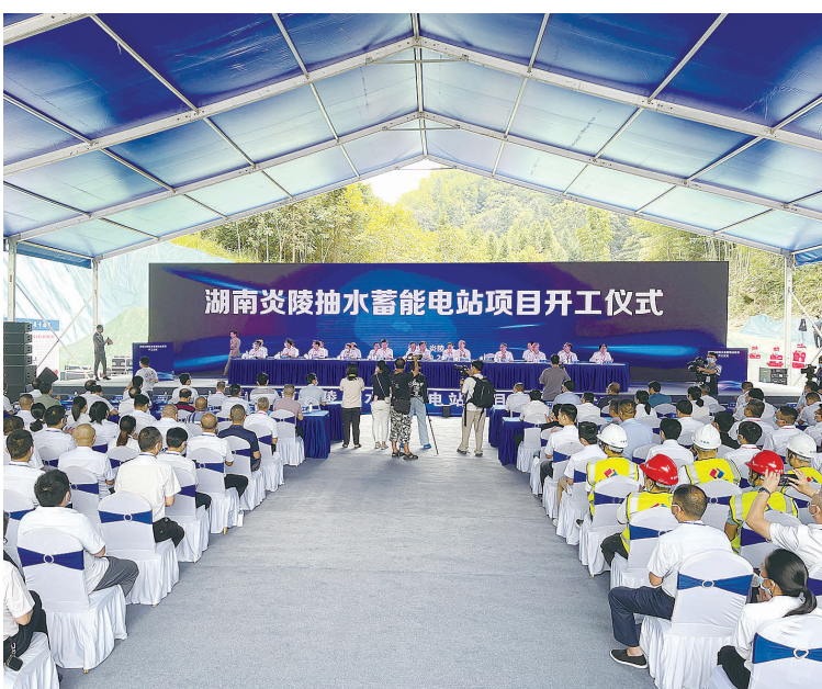
炎陵抽水蓄能电站项目开工。