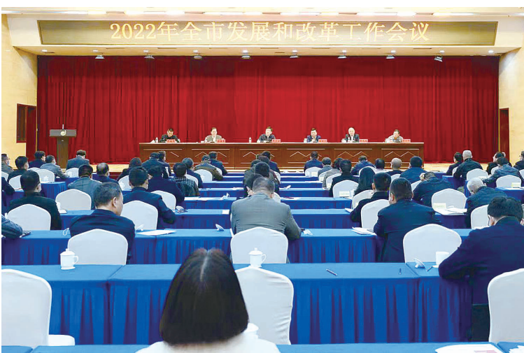
2022年全市发展和改革工作会议召开。