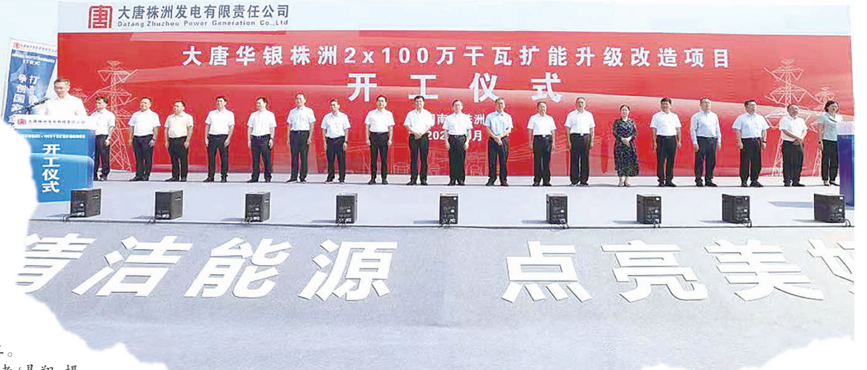
大唐华银株洲2x100万千瓦扩能升级改造项目开工。

今年，我市打造强化“三个高地”指挥部统揽，以超常规举措抓重点项目，全力培育制造名城、建设幸福株洲。市发展改革委更是主动担当作为，积极牵头推进，争分夺秒抢时间、赶进度，全力推动项目建设提速增效。