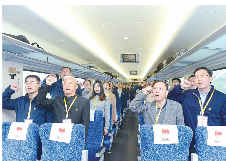
市发展改革委委员登上湘赣边“红色专列”，开展党性教育活动。