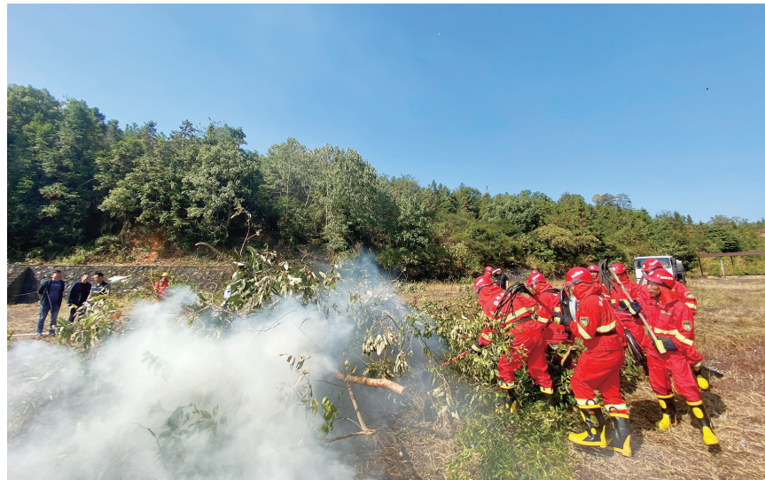
森林火灾应急救援队利用灭火机、灭火拖把进行扑火作业。

演练开始前,天元区消防大队栗雨中队专职消防员,还对在场人员进行了森林防火设备器材使用培训,并对消防车单枪操作流程进行演示,确保大家熟