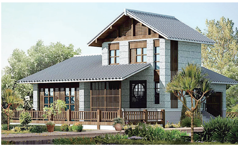
民居产品案例效果图