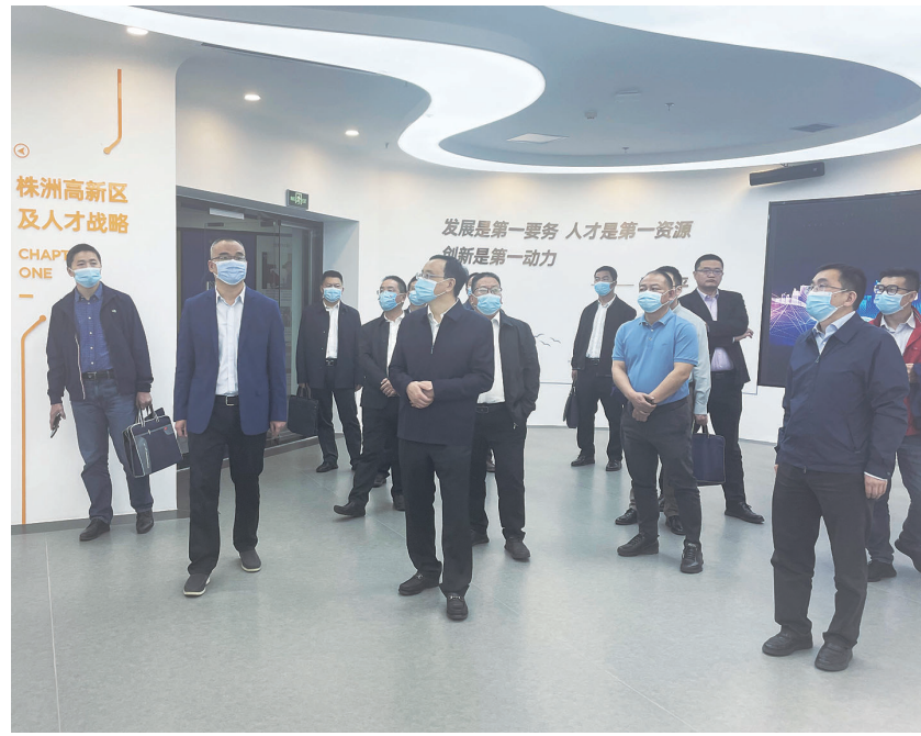
省人社厅领导调研株洲高新区人力资源服务产业园。

服务和市场化服务紧密结合,政府促进就业和产业用工需求紧密结合,进一步优化发展规划,聚集更多优质机